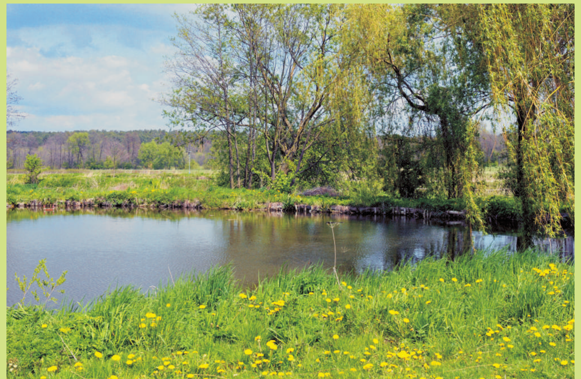
Stawy w Dzierzkowicach-Woli na wiosnę...