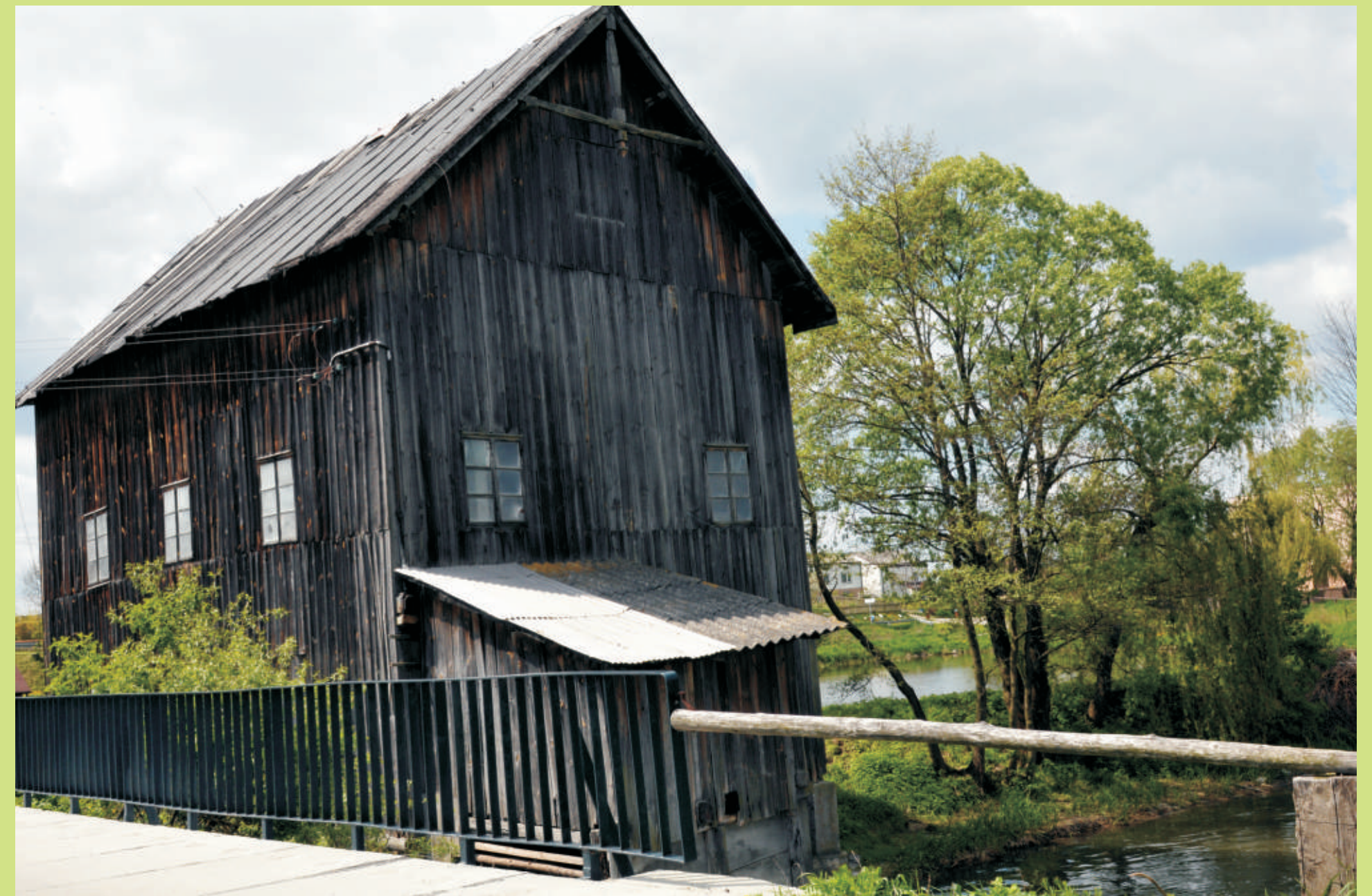
Młyn w Dzierzkowicach-Woli

Stawy w Dzierzkowicach-Woli – malowniczo położony kompleks stawów rybnych. Od północy graniczy z dużym obszarem leśnym z przewagą drzew iglastych, z rezerwatem przyrody „Natalin” (gmina Urzędów). Na skraju lasu znajduje się cmentarz wojenny w Chruślankach Józefowskich.