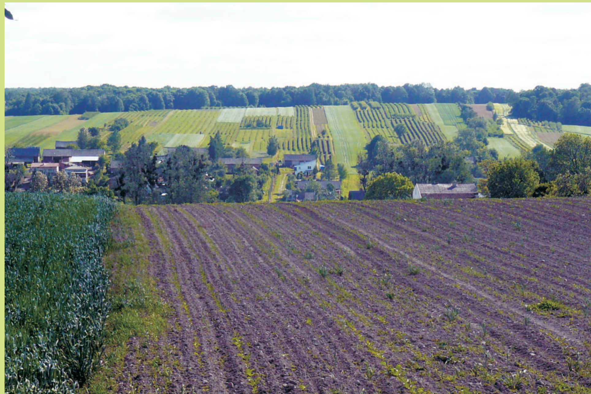
Widok w kierunku zabudowań i pól Zastawia

Miejsce znajdujące się wśród pól, przy drodze gminnej, na wysokości bezwzględnej około 205 m n.p.m. Rozległy widok: od północy – na dolinę rzeki Urzędówki i Wolski Bór, od południowego zachodu – na obszary rolnicze miejscowości Dzierzkowice-Zastawie.