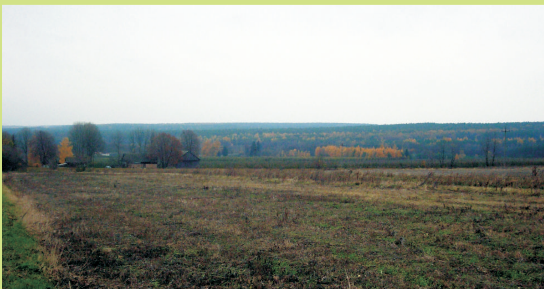
W oddali Wolski Bór późną jesienią