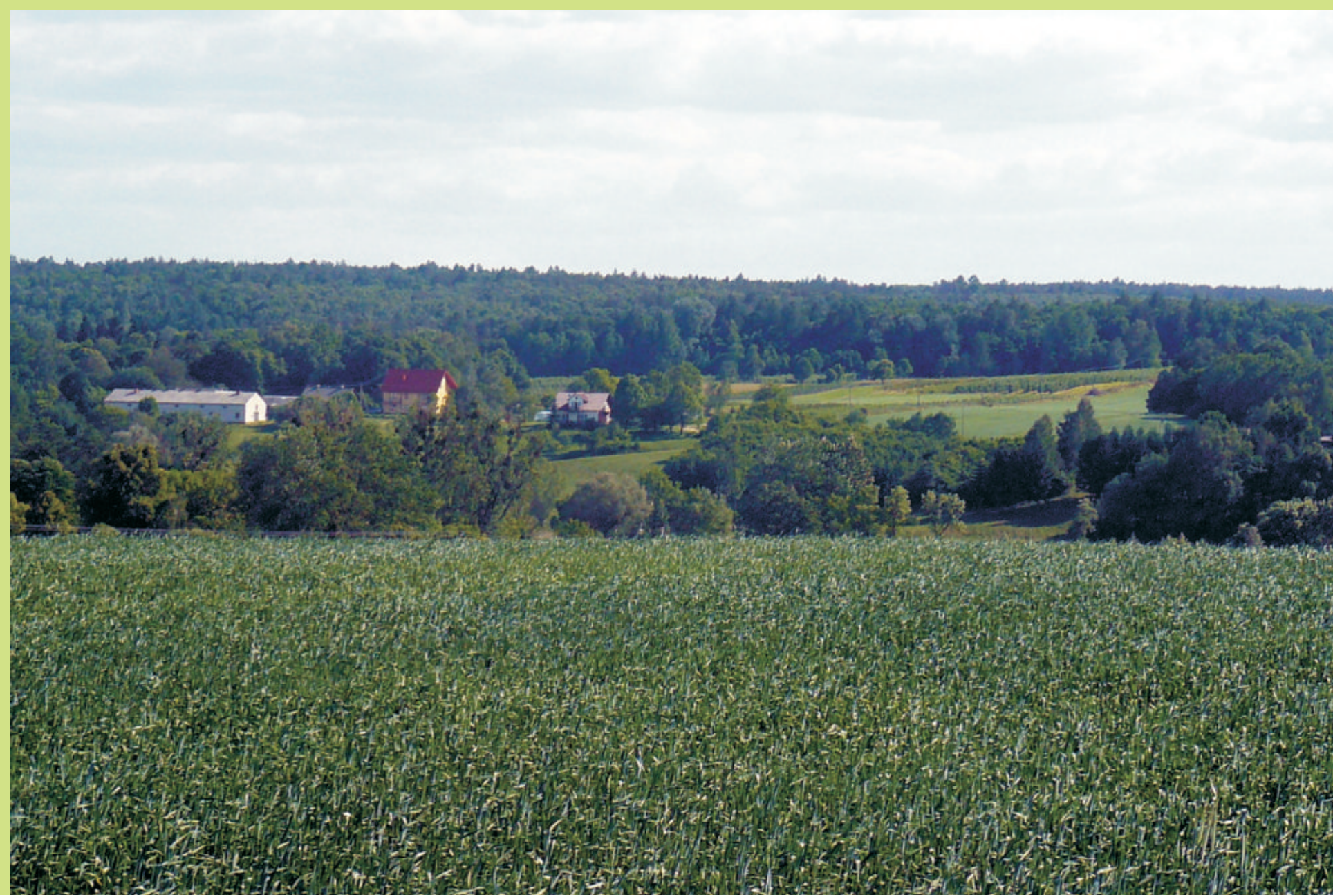
Widok w kierunku Wzgórza Zamkowego