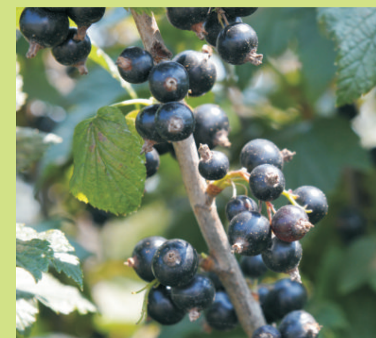
W tej okolicy jest wiele plantacji malin i porzeczek